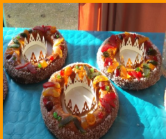
Gâteaux des Rois